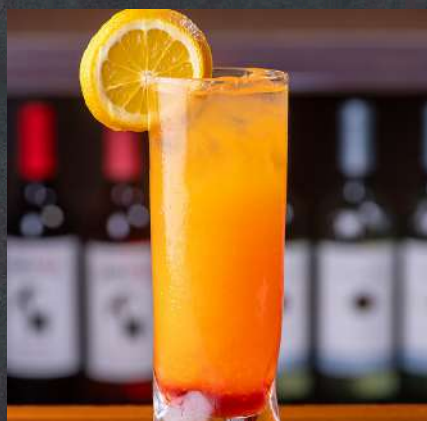
TEQUILA SUNRISE 22