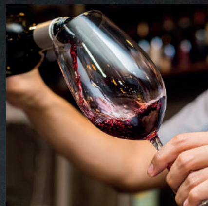
TAÇA DE VINHO 22