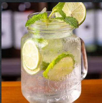
GIN TÔNICA 28