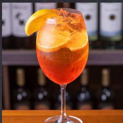
APEROL SPRITZ 28