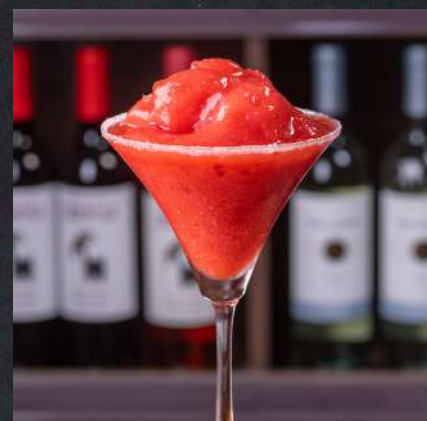
MARGUERITA FROZEN* 26